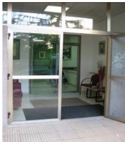
Centro de Día Amencer-Aspace –Campolongo-Pontevedra