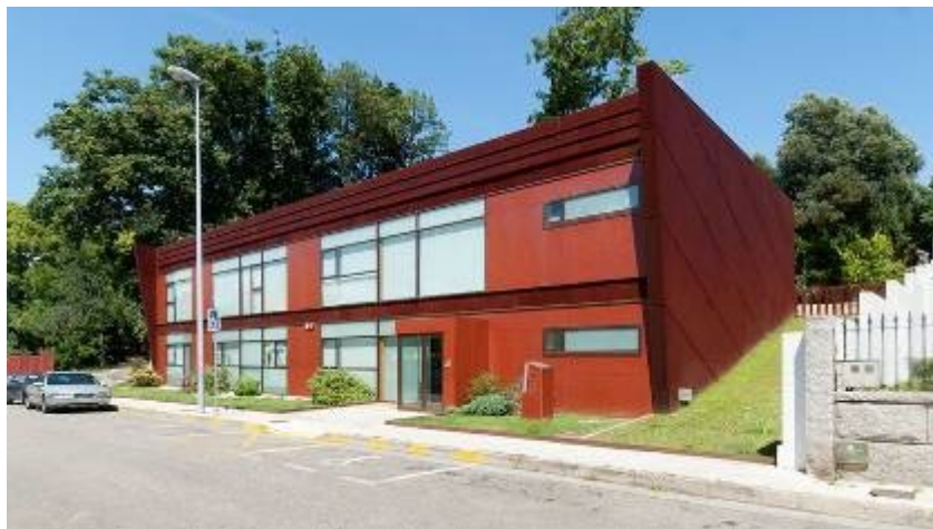
Centro Atención Integral PRINCESA LETIZIA ( Villagarcía)