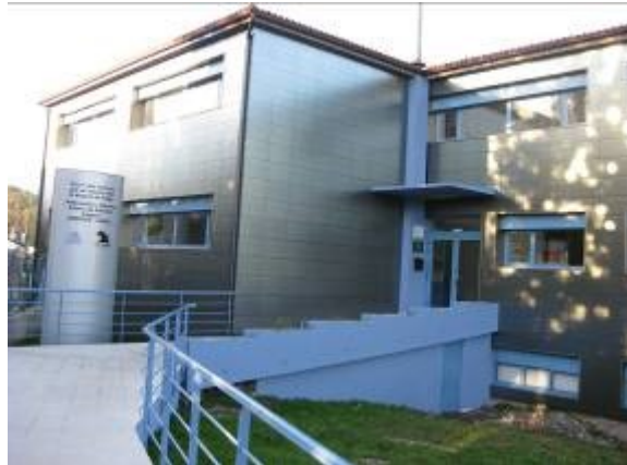
Centro Atención Integral AMENCER-ASPACE (Pontevedra - Lourizán)